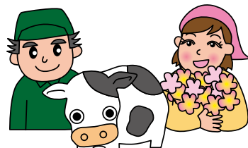
農地の権利名義を持たない 畜産農業者・施設園芸等農業者など