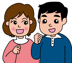
後継者とその配偶者