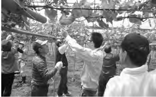
JA営農技術員による房切り講習会

当市は、日照の多さと少雨に加え、昼夜の温度格差が大きいという果樹栽培に適した気象条件の下で、平成二十年