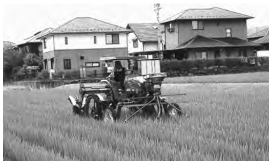
化学肥料・農薬の削減による白ねぎ栽培

白ねぎがJA上伊那の重点品目として位置づけられたのを機に、平成十六年から栽培に取り組み、平成二十二年度は四・五畝にまで栽培面積が増加しています。