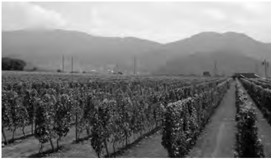
遊休農地を活用したワインぶどう園

高山村では、平成十七年から、遊休農地を活用して、比較的労力がかからず、初心者でも栽培しやすいワインぶどうの振興に取り組んでいます。